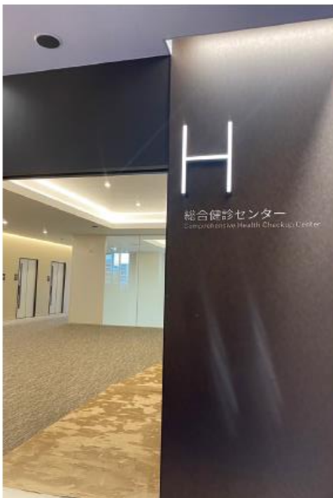
総合健診センターはエスカレーター昇って右手、2階です。