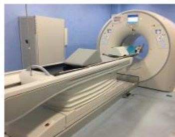
Digital PET-CT [Cartesion Prime]