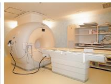
MRI [Intera Achieva 1.5T NOVA]