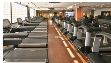
筋トレや有酸素マシンを中心に100台を超える先進マシンがずらり!