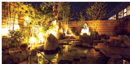
日本庭園のような露天風呂